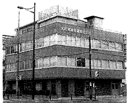
大和無線電器の本社ビル

各人が関連するセミナーに積極的に参加することで知見を習得して、レベルアップを図る。電子部品販売事業はタツチパ