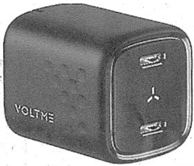
Type-Cポートを二つ搭載した30W急速充電器