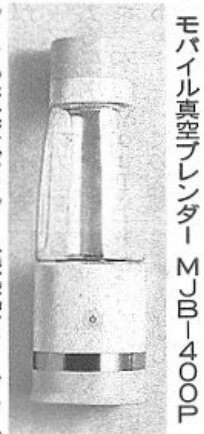
モバイル真空ブレンダー MJB-400P

真空構造とチタンコートブレードを採用し、素材本来のおいしさを味わえる。フルーツをイメージしたニュアンスカラーの3色展開とした。価格はオープン。